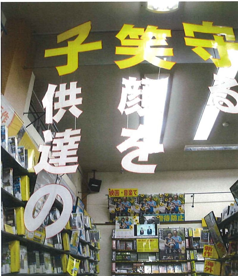
2015年、全国レンタル店対象の CDVJ ショップコンテストにて 優秀賞 を獲得。