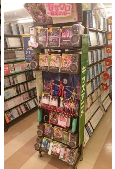
現在のももクロコーナー

こちらはスタッフさんが作成していただいたコーナーです。 ラブライブは今年一年を通じていろいろな場所でコーナーにしました。 その中でも劇場版発売の事前コーナーの中段が素晴らしかったので解体直前に写真をとっておいでもらいました。電飾まで入っています。