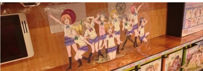
こちらはCDのコーナー ここにいる女の子の画像が全部同じ子だと気づいた時には戦慄が走りました(笑)