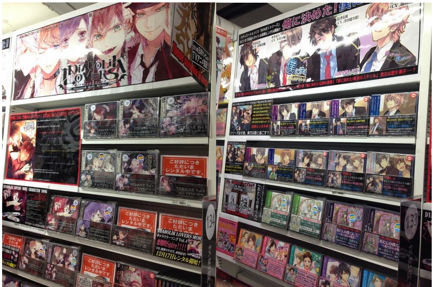
奥に行くにつれて段々ディープな世界に…。BLやピロウトークなど過激な内容もよく回ります。