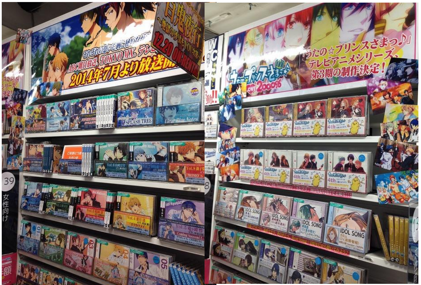
入口はライトなアニメで広くお客様を誘導。上記以外も鬼灯の冷徹・ダイヤのA・黒子のバスケ等を展開