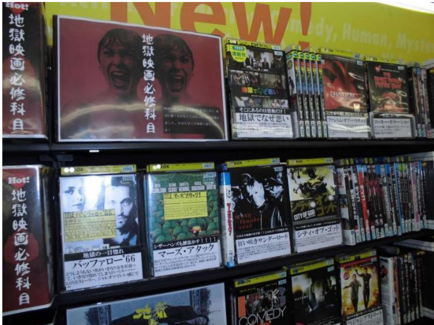
「地獄」をテーマに学生さんならではの感性で表現されたコーナー（6種類）