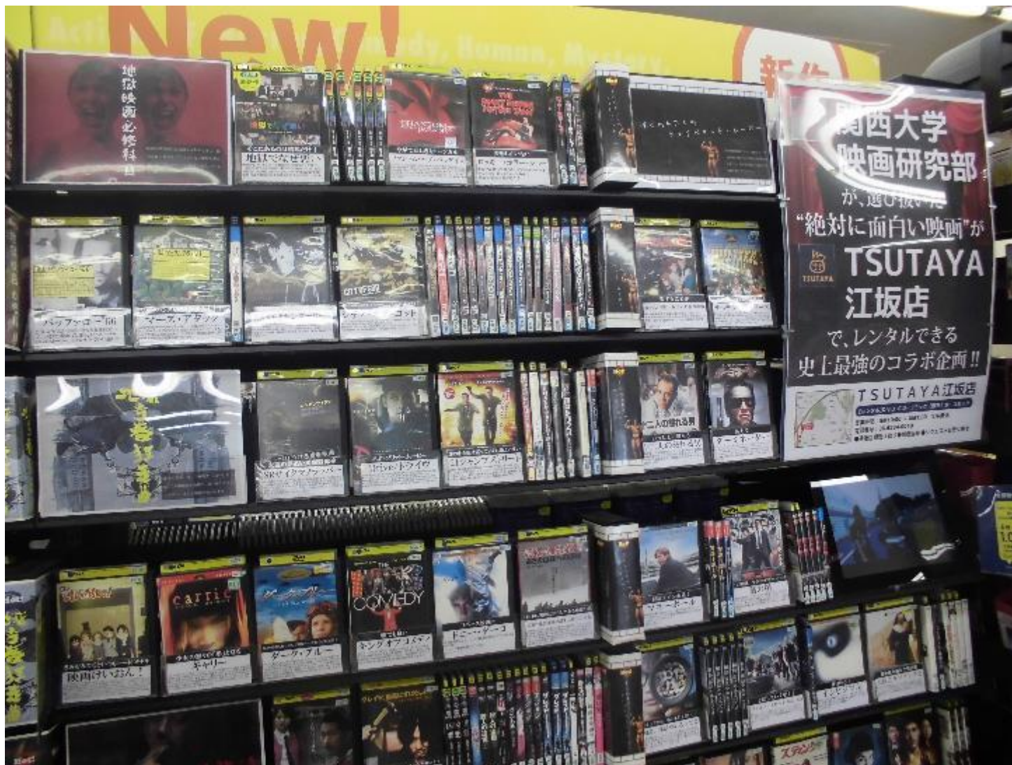
映像売場の一等地で目立つように2スパン展開